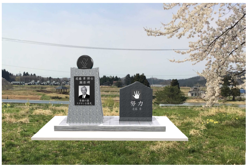
遠藤博士の希望を踏まえ下郷分校跡地に建立予定の顕彰碑(写真はイメージ)

顕彰碑のデザインは、「自然界から発見されたスタチンが世界の人々を救う」をコンセプトに、①台座は自然界を表現。②本体はスタチンの発見〜完成までの博士の研究過程を表現。③側面の中央部分は、博士の研究開発過程の内なるエネルギーを表現。④上部のヘッド部分は最初に発見されたコンパチンの化学式を表現。⑤裏側には博士の受賞